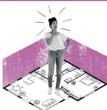
Penser autrement l'habitat