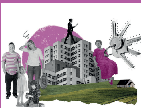
Mettre les femmes au cœur de la politique du logement

réalisées par le CWEHF illustrant l'intérêt d'intégrer la dimension genre dans les politiques urbanistiques et du logement